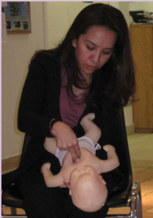
Una mujer hace prácticas de CPR infantil como parte del Día Go Red por tu corazón en el Consulado de México en Nueva York.