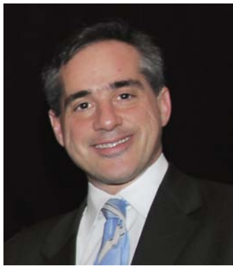
David J. Shulkin, MD